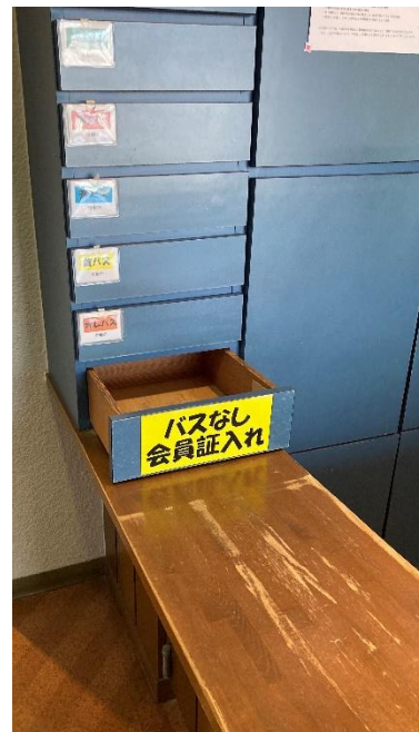
③フロント横の引き出しに会員証を入れてください。